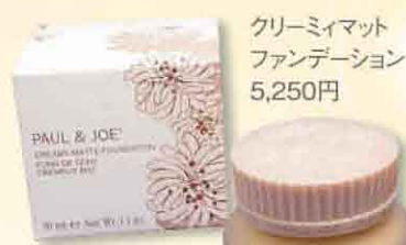
クリーミーマット ファンデーション 5,250円