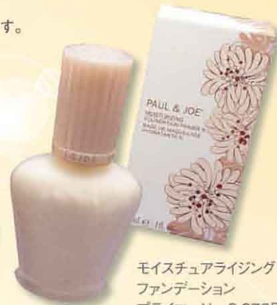
モイスチュアライジング ファンデーション プライマー-N 3,675円

しっかりカバーしながら軽い仕上がりのセミマットファンデーション。また、大人気の下地がトリートメント成分をUPさせ登場。使いやすいディスペンサータイプになりました。