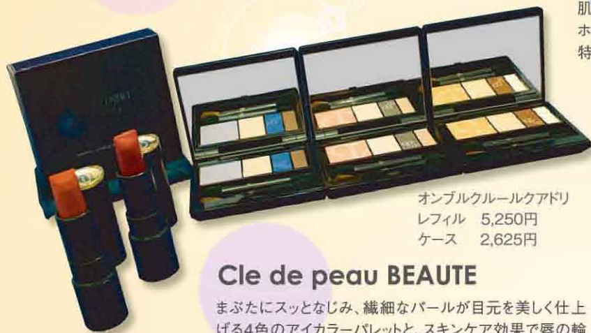
オンブルクルールクアドリ レフィル 5,250円 ケース 2,625円

夏の紫外線を受けた肌に、輝くような透明感を与える美白美容液。そして表面ケアに着目した溶け出すクリーム。キメ、ハリ、ツヤが続く保湿クリームです。