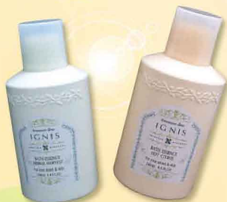
バスエッセンス ハーバルハーベスト、ホットシトラス 2,625円