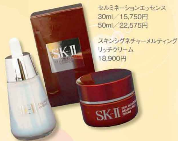
セルミネーションエッセンス 30ml / 15,750円 50ml / 22,575円

肌と心を癒すシソ科ハーブの化粧水。ホテリや乾燥、その他の肌トラブルも解消！特にローションマスクで使用するのがおすすめです。