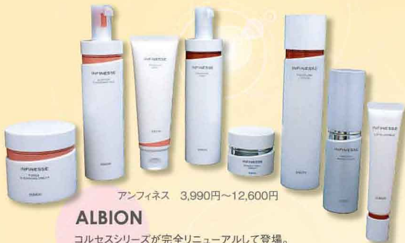
アンフィネス 3,990円~12,600円