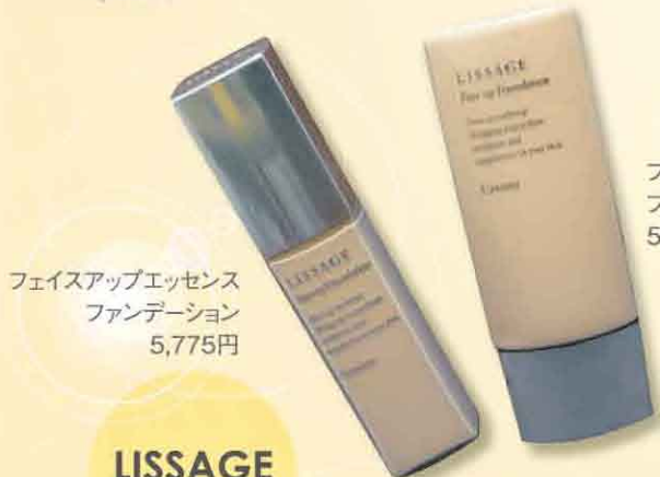
フェイスアップエッセンス ファンデーション 5,775円