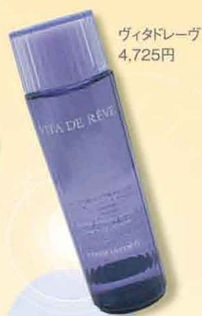
ヴィタドレーヴ 4,725円

コルセスシリーズが完全リニューアルして登場。目に見える上向きのハリを目指す、エイジングケアラインです。